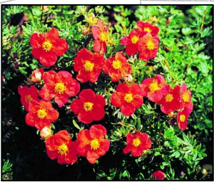
Pięciornik Krzewiasty - Potentilla Fruticosagold Red Ace