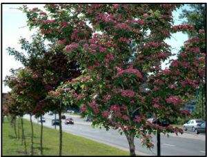
Głóg Dwuszyjkowy - Crataegus Laevigata