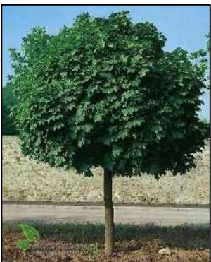
Klon Zwyczajny - Acer platanoides L.