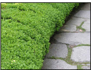
Bukszpan Wieczniezielony (wys. 50 cm) - Buxus Sempervirens L.