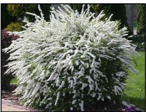
Tawuła Szara - Spiraea Cinerea Grefsheim