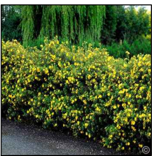
Pięciornik Krzewiasty - Potentilla Fruticosagold Teppich