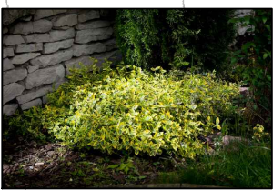
Trzmielina Fortune'a - Euonymus Fortunei Emerald'n Gold